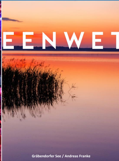
Gräbendorfer See / Andreas Franke