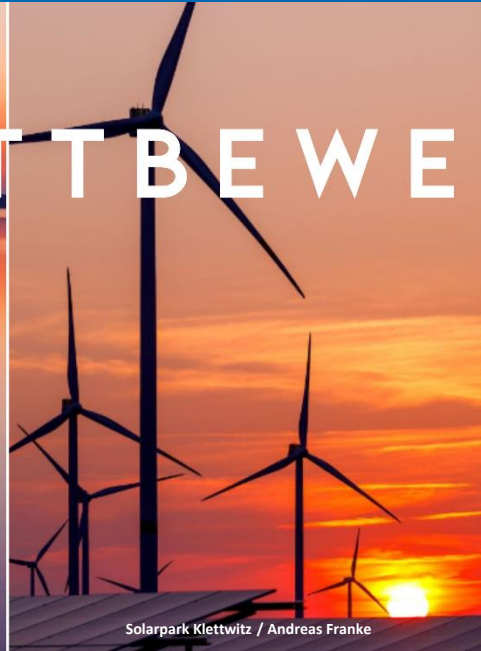
Solarpark Klettwitz / Andreas Franke