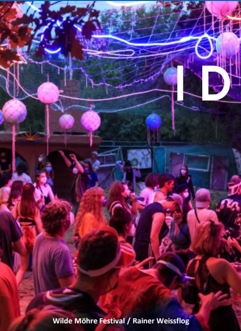
Wilde Möhre Festival / Rainer Weissflog